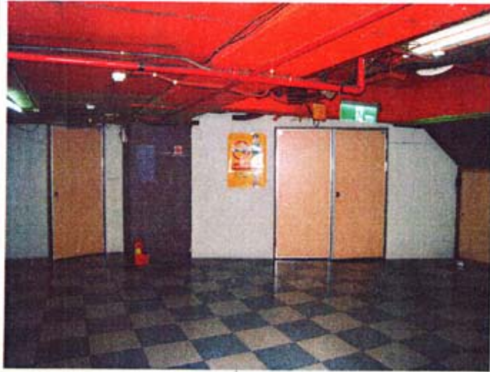
5 位置：防火门及砂酸鈣板隔間牆