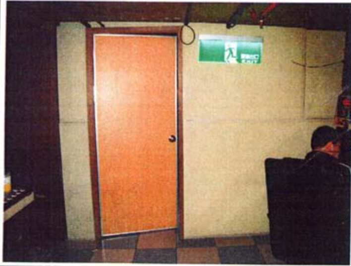
6 位置：防火门及砂酸鈣板隔間牆。